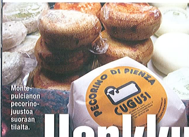
Montepulcianon pecorinojuustoa suoraan tilalta.

Juuri tämä on se hetki, joka saa rakastumaan taloon Toscanan kukkuloilla. ■